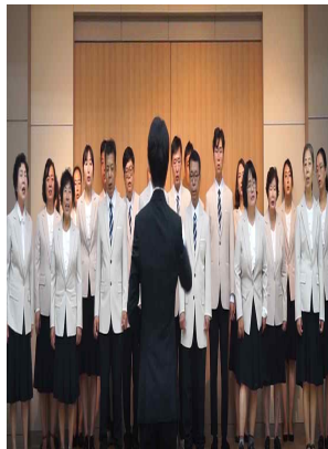
[2부 축하공연] 드림합창단 (광명시정신건강복지센터)