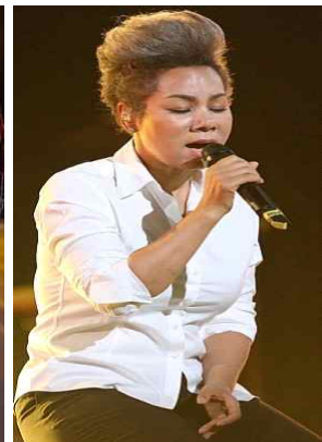
[2부 축하공연] 인순이 (가수)