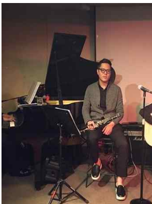
[1부 축하공연] 낮선시간 (정신신체질환자 콜라보 무대)