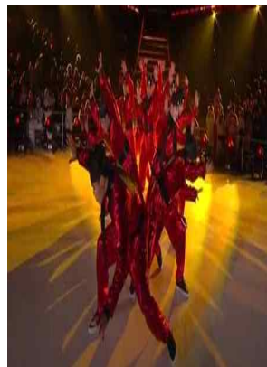
[2부 축하공연] 저스트절크 (평창올림픽 개막식 공연팀)